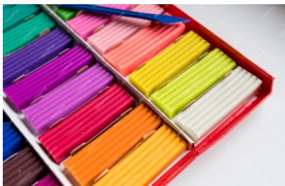
1. kép. Gyurmakészlet