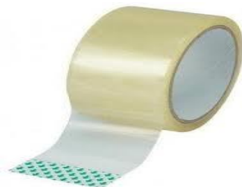
2. kép. Cellux